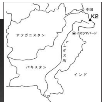
K 2 全容