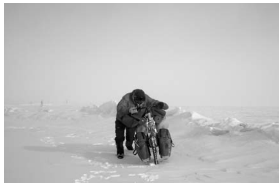
自転車で走行中を三脚を立てて自分で撮影。 自転車が壊れたら押せばいい。