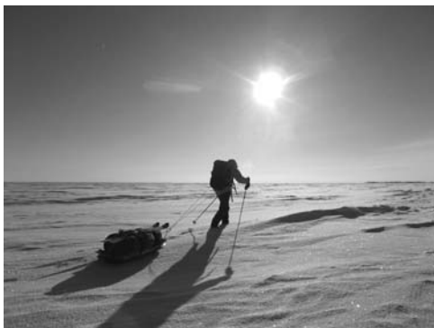
カナダ中央平原を歩いて行く